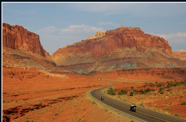
8. Capitol Reef