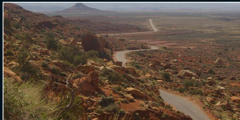
9. Côte de la Vallée des Dieux