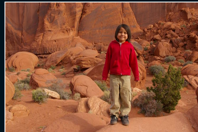
11. Enfant Indien Navajo