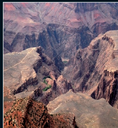
2. Grand Canyon

Découvrez ce circuit dans la nouvelle édition de notre livre «L'Ouest Américain» (Bon de commande p. 51)