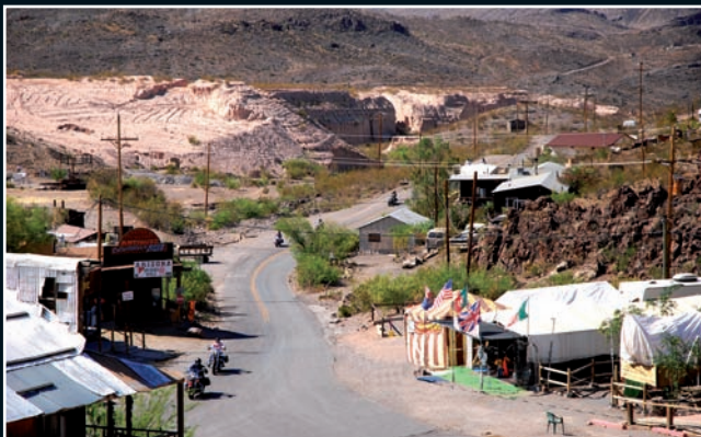
5. Route 66, Oatman