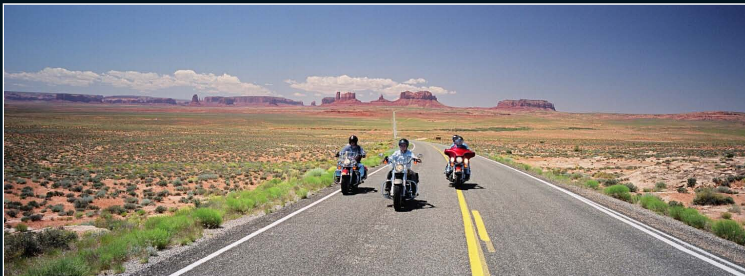
7. Sortie Nord-Est Monument Valley