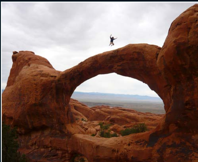
6. Arches National Park