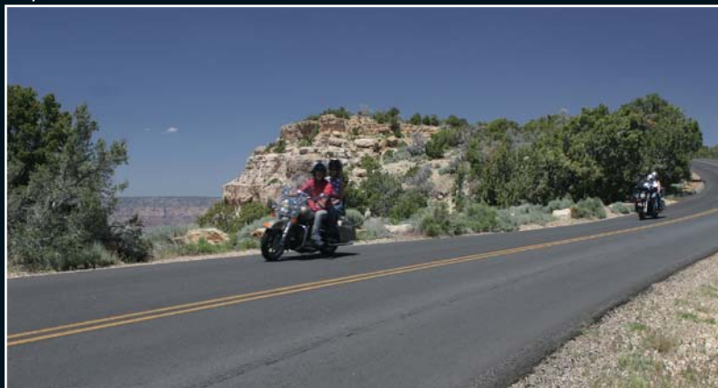
10. Escalante National Park