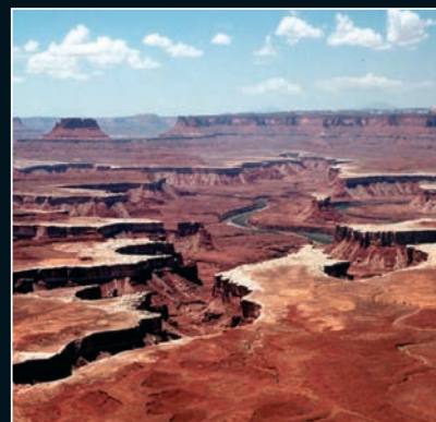
1. Canyonlands, à découvrir sur la version 10 et 13 jours.