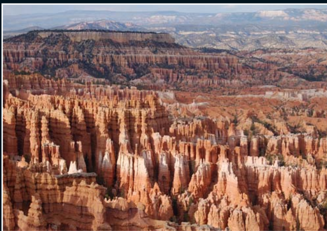
4. Bryce Canyon